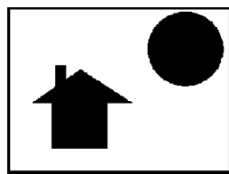
[3] 2 値反転画像